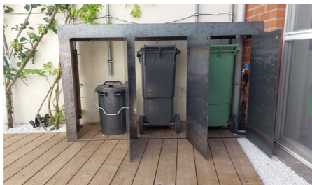
Een praktische tuinkast afgewerkt met kruiden- of plantenbak is een ideale oplossing voor nuttige maar minder fraaie objecten.