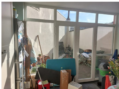
Dit koertje van 12 m 2 schreeuwde om een make-over.

Een leuk stadstuintje kan ook op een kleine oppervlakte en ingesloten tussen muren.