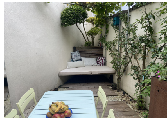
Elk hoekje, hoe vreemd ook van vorm, kan benut worden. Zoals hier met een bankje en een plantenbak op maat.

Een zakdoek groot en heel vaak een vuil hoekje waar de rommel van lege potjes zich naast de vuilnisbakken opstapelt. Nochtans kan je van een stadskoertje een kleine groene oase maken die je een instant vakantiegevoel geeft. Tien tips van een expert.