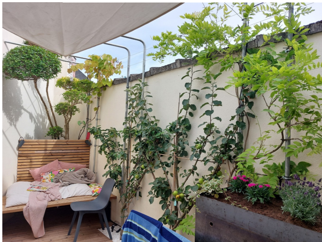
Standaardmaten of -meubelen zijn in dit tuintje geen optie. En denk voor de inrichting ook eens aan alternatieve materialen.